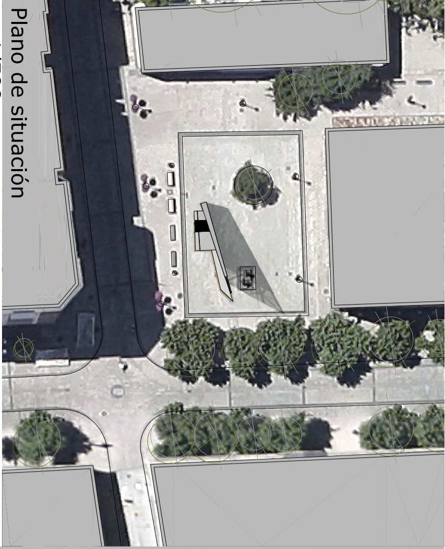
Plano de situación e: 1/500